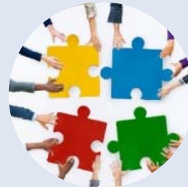
HR and HR IT