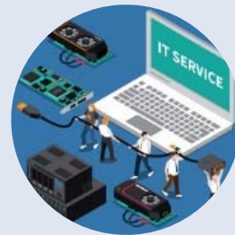
IT Infrastructure and IT Food store