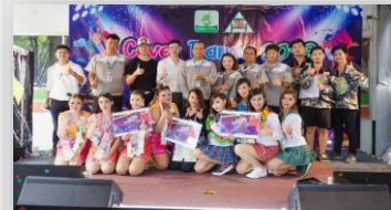
2018 -2021 (Step 3)