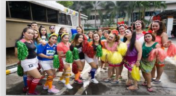
2010-2017 (Step 2)