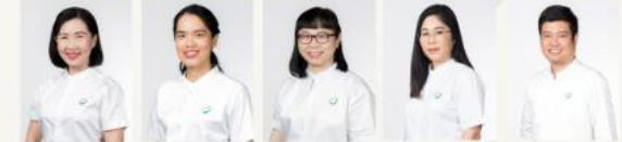
Digital and Information Technology