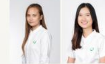
Human Resource Strategy and Development